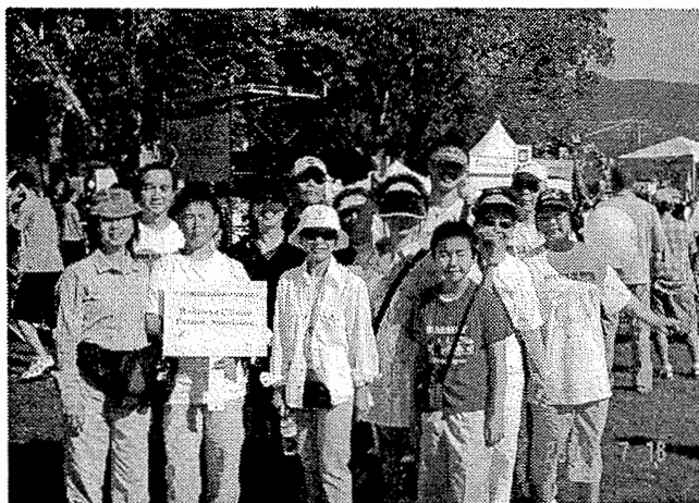
7月18日中僑互助會百萬行